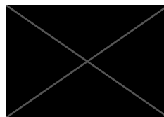
Firma / meno priezvisko zákazníka Základná umelecká škola Miloša Ruppeldta